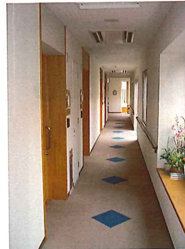
居室への入口廊下