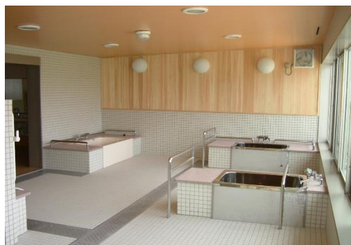
●快適な入浴は施設生活の楽しみ