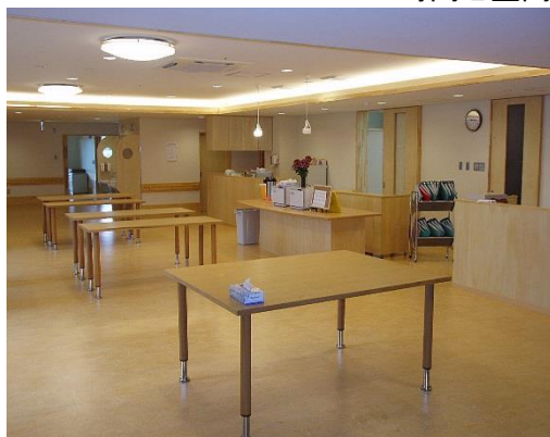
●利用者の視点に立ち、地域と共に歩み信頼と思いやりのあるサービスの提供