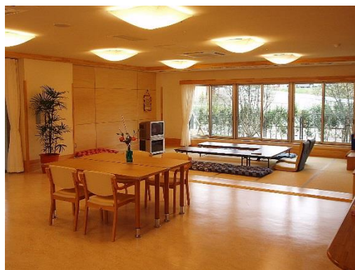
●季節感に溢れ、生きがいのある楽しい生活

デイサービスセンターは認知症の方に効果的と言われる脳の活性化を図る訓練を実施する他、落ち着いたその人らしい暮らしを支援するために小人数制で、家庭的な雰囲気と適切なサービスを提供いたします。